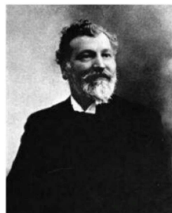
Anatole Le Braz.

AMÉRIQUE DU NORD 1906-1920. L'Alliance française aux États-Unis et au Canada le solli-